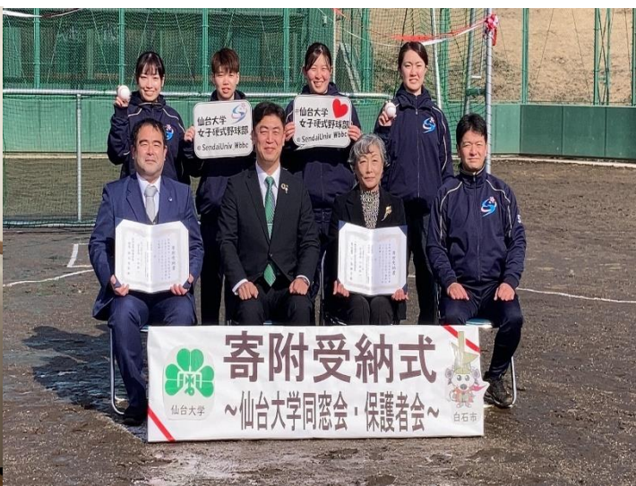
【R5.3.18 東北・北海道支部長会議(仙台大学)】