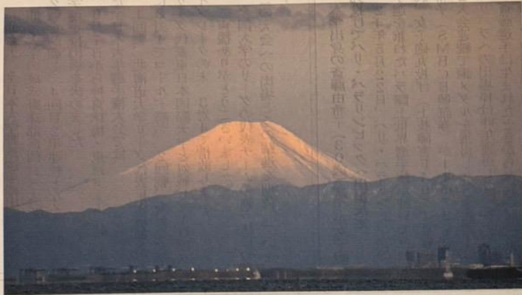
140キロの彼方、東京湾から望む朝陽の富士(手前の山並は神奈川県丹沢山系) 千葉県習志野市茜浜から撮影